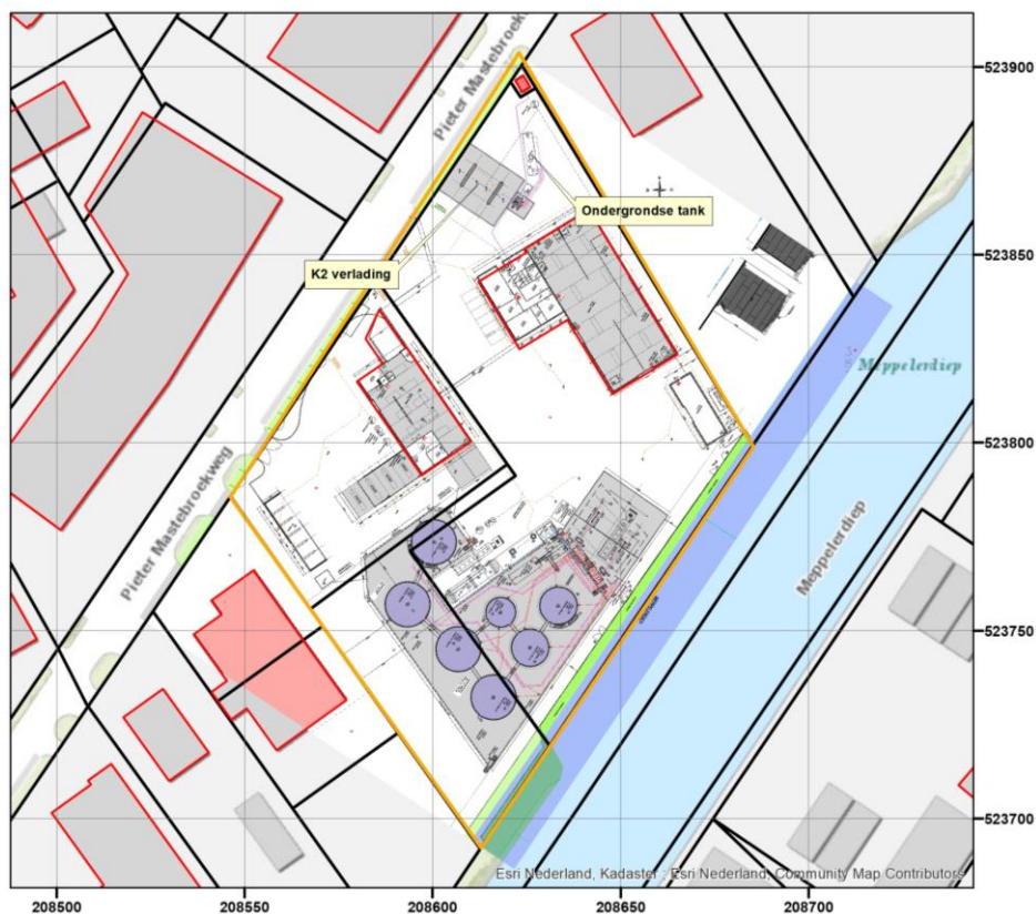
Figuur 1. Situatie toekomst Joontjes B.V.