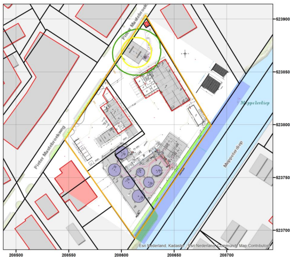
Figuur 2. Plaatsgebonden risicocontouren

Figuur 3 toont de plaatsgebonden risicocontouren. Het plaatsgebonden risico is kleiner dan de grenswaarde van 1.0 \cdot 10^{-6} /jr. Hiermee wordt voldaan aan het Bevi.